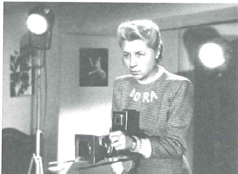
Chuck Samuels, Untitled , de la série Chuck Goes to the Movies , 2009, installation photographique, épreuves numériques, 108 photographies, 20,3 x 25,4 cm ch.

Il s'agit d'abord d'une étude de la façon dont était introduit le personnage du photographe dans le cinéma populaire des années 1900 à 1970. C'est la représenta-